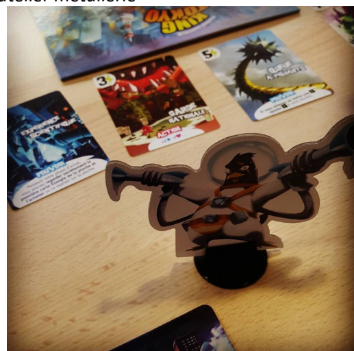
King of Tokyo