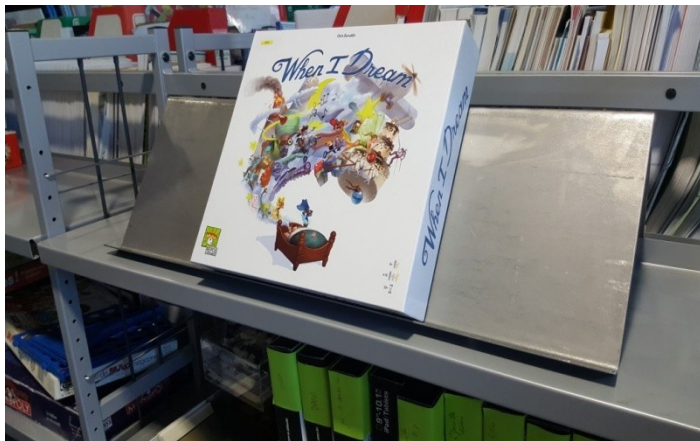
présentoir réalisé par les élèves de l'atelier métallerie