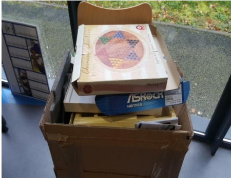
Les vieilles boîtes sont jetées