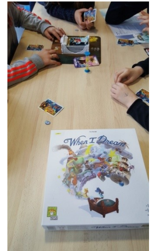
Elèves jouant à When I Dream