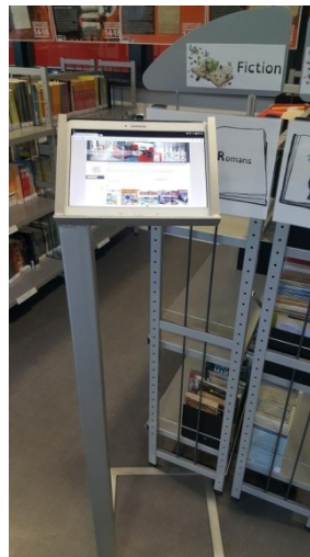
Support pour tablette réalisé par les élèves de l'atelier métallerie