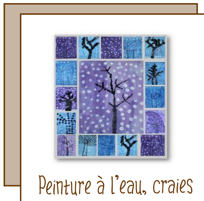
Peinture à l'eau, craies