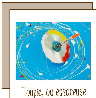
Toupie, ou essoreuse