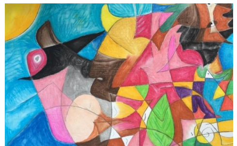
Nouvel An Perse de Rusta

-une pratique possible autour de la mosaïque