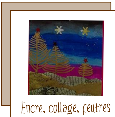
Encre, collage, feutres