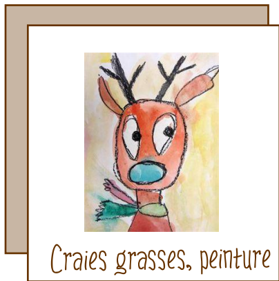
Craies grasses, peinture